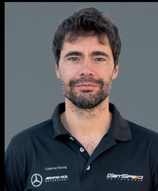
ANTAR SOLO FAHRZEUGINGENIEUR #8